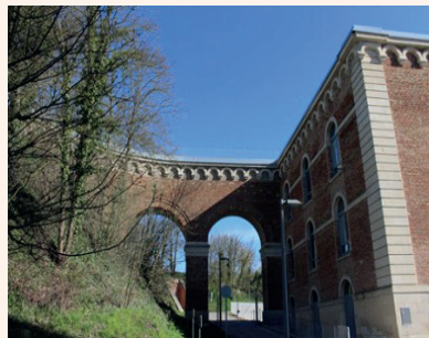
Impression : Reprographie Citadelle - U.P.J.V - 2022

Agence Nationale de la Recherche, Ministère de l'Education Nationale, Direction de l'Evaluation, de la Prospective et de la Performance (DEPP), Ministère de la Culture et de la Communication, Région Hauts de France, Agence nationale de sécurité sanitaire de l'alimentation, de l'environnement et du travail (ANSES), Maison Européenne des Sciences de l'Homme et de la Société Lille, Agence de l'Environnement et de la Maîtrise de l'Energie (ADEME), Institut de Recherche pour le Développement (IRD), Centre national d'études spatiales, Agence nationale de recherches sur le sida et les hépatites virales, Association Régionale des Élus pour la Formation, l'Insertion et l'Emploi, Mission de la Recherche Droit et Justice.